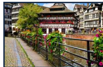
20 place des Halles 67000 Strasbourg +33 9 78 45 00 08 contact@france-prepa.com