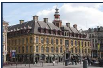
38 Bd Carnot 59800 Lille +33 9 78 45 00 08 contact@france-prepa.com