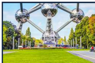
11 rue des Colonies 1000 Bruxelles +33 9 78 45 00 08 contact@france-prepa.com