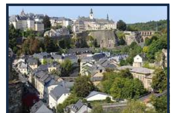
2 rue Edward Steichen 2540 Luxembourg +33 9 78 45 00 08 contact@france-prepa.com