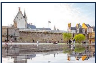
22 Mail Pablo Picasso 44000 Nantes +33 9 78 45 00 08 contact@france-prepa.com