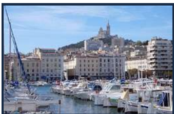
154 rue de Rome 13006 Marseille +33 9 78 45 00 08 contact@france-prepa.com