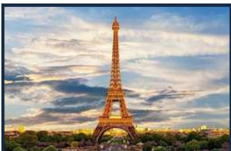
1 Place de la République 75003 Paris +33 9 78 45 00 08 contact@france-prepa.com

Nos cours sont aussi accessibles depuis toute la France en cours individuels par visioconférence sur notre plateforme .