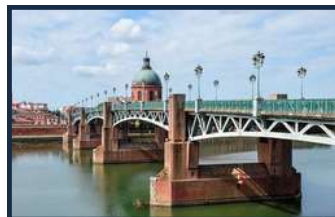
66 bd de Strasbourg 31000 Toulouse +33 9 78 45 00 08 contact@france-prepa.com