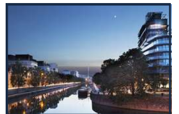
20 rue d'Isly 35000 Rennes +33 9 78 45 00 08 contact@france-prepa.com