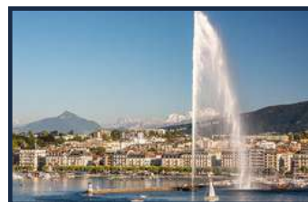
77 rue de Lyon 1203 Genève +33 9 78 45 00 08 contact@france-prepa.com