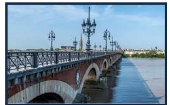
55 rue Ségalier 33000 Bordeaux +33 9 78 45 00 08 contact@france-prepa.com