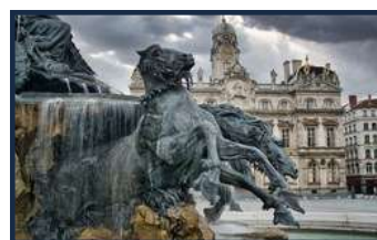
40 Rue des Remparts d'Ainay 69002 Lyon +33 9 78 45 00 08 contact@france-prepa.com